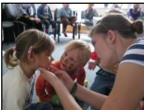
A Klubíčko – Den dětí

Od roku 2009 vytváříme koncepci aktivit, která by odpovídala RVP pro MŠ upravenému pro naše podmínky. Tomu se snažíme přizpůsobit i dosavadní vybavení A-Klubíčka. Dokupujeme více odborné literatury, didaktických hraček, cvičebních a jiných pomůcek. Do budoucna také plánujeme pořádání odborných přednášek pro rodiče a různé výlety a akce pro děti.