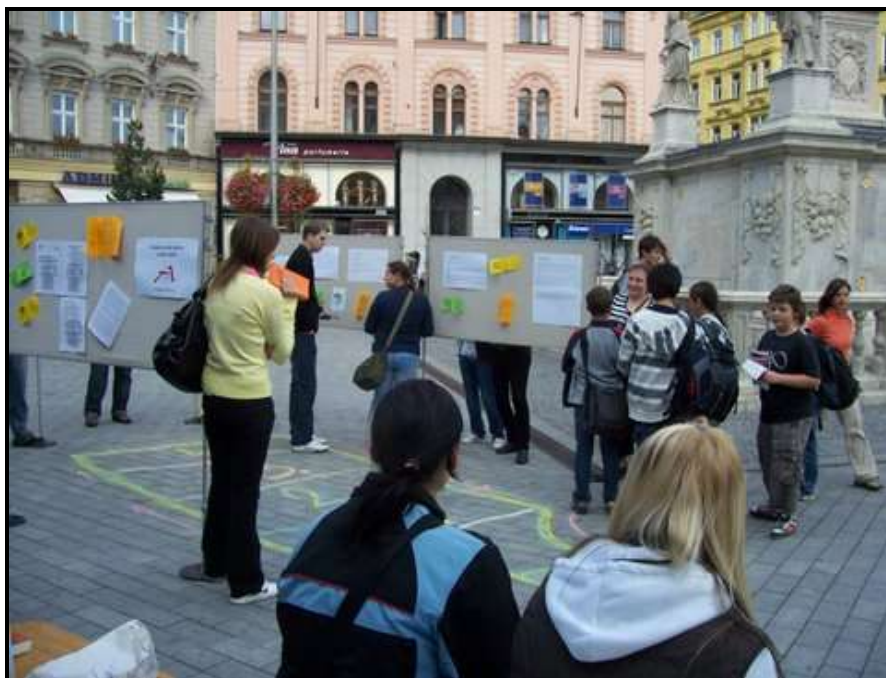
Cesta na dno lahve a zase zpět Akce pro širokou veřejnost v rámci brněnských dnů pro zdraví.

A Kluby se podílí i na osvětové činnosti ve svém regionu, v roce 2009 to bylo zejména prostřednictvím tvorby osvětových akcí a materiálů pro příbuzné a blízké závislých osob pro osoby potýkající se se závislostí.